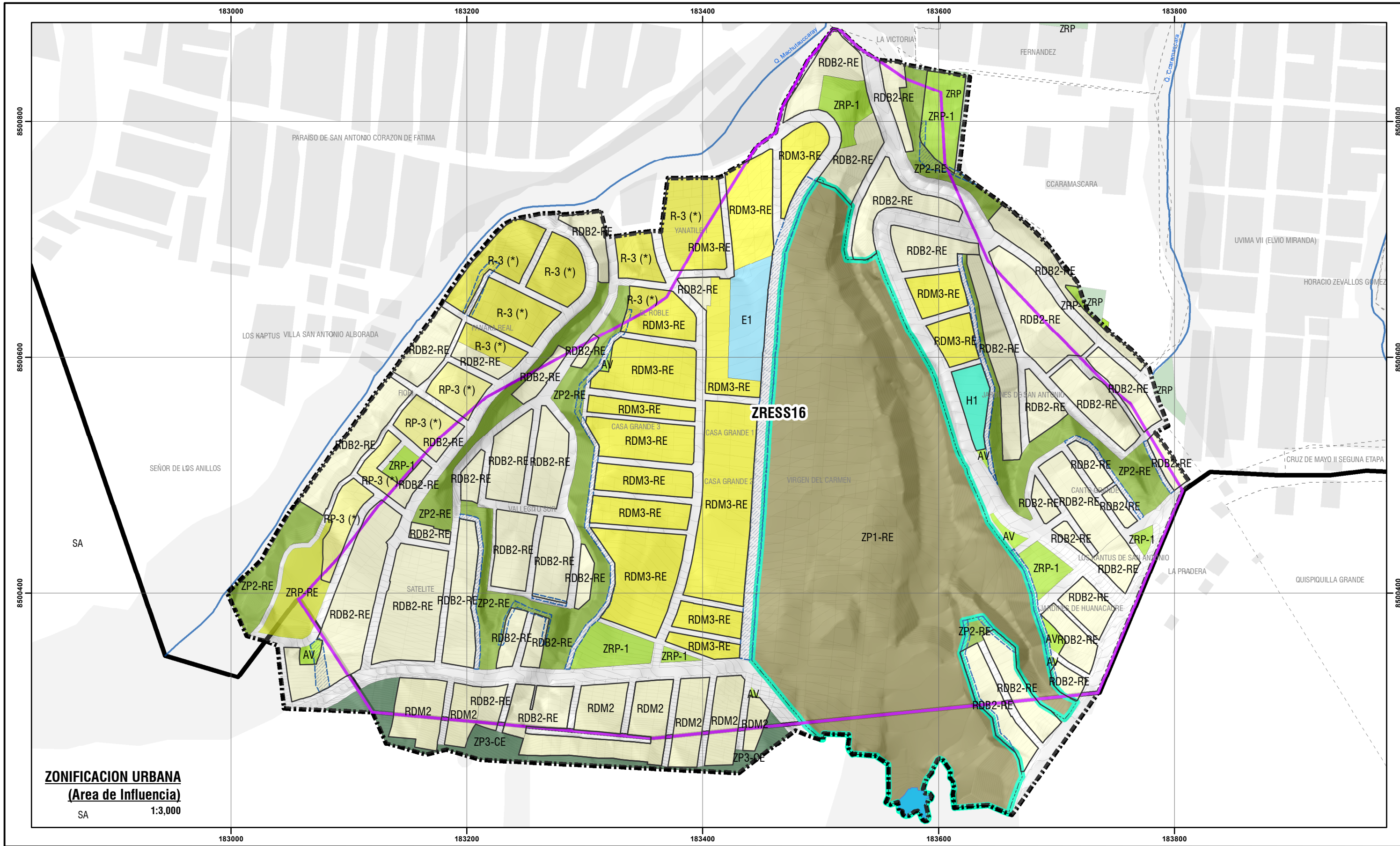
ZONIFICACION URBANA (Area de Influencia) SA 1:3,000