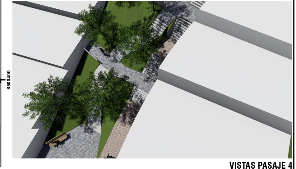
VISTAS PASAJE 4